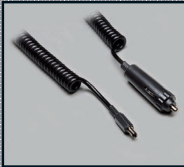
PUR-Mantel Auszugsverhältnis 1 : 4