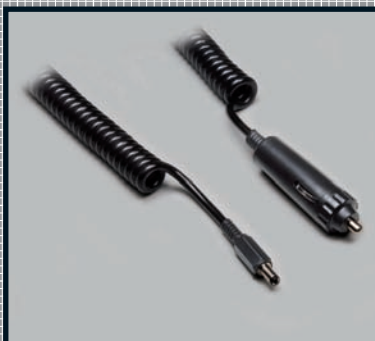
PUR-Mantel Auszugsverhältnis 1 : 4