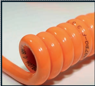
PUR-Mantel Auszugsverhältnis 1 : 4