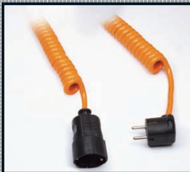
PUR-Mantel Auszugsverhältnis 1 : 4