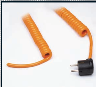
PUR-Mantel Auszugsverhältnis 1 : 4